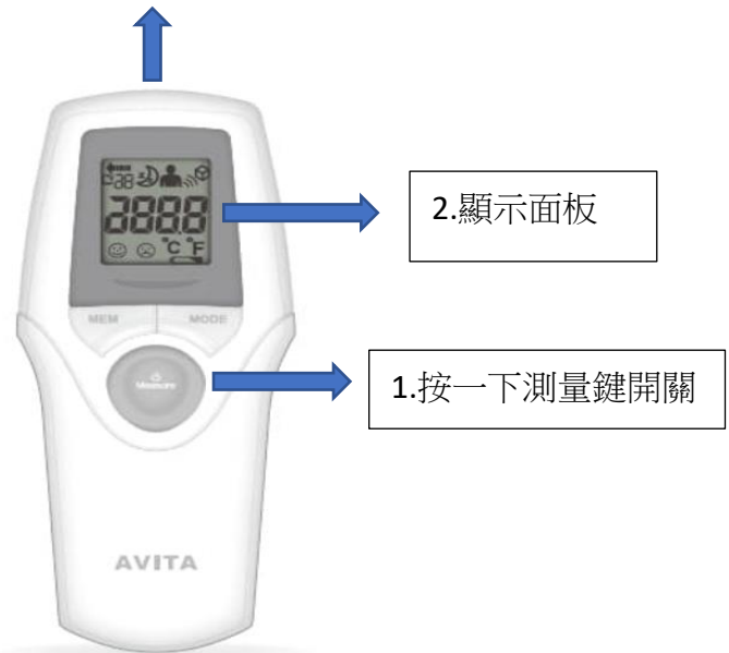
非接觸式紅外線體溫計 型號：NT19 非接觸型