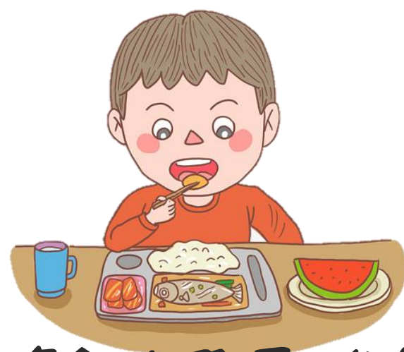
專心吃飯少聊天 公筷母匙